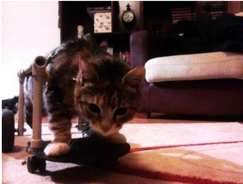
Die Gehhilfen gibt es auch in Katzengröße.

Über sein Produkt sagt Dragan: „Die Hundegehhilfen aus dem Westen sind vielleicht der Mercedes. Ich baue einen Fiat 500. Aber der tut es auch.“