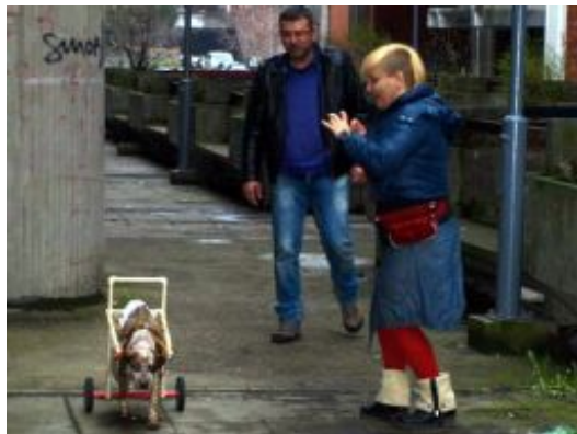
Die Gehhilfen für Hunde sorgen für großes Aufsehen.

Natürlich waren die beiden eine Attraktion. Und schon bald kamen Anfragen an Dragan von anderen Hundebesitzern in Serbien. Inzwischen verkauft er seine Entwicklung bereits in fast allen ehemaligen jugoslawischen Teilrepubliken für 60 bis 130 Euro. Damit zu einem Preis, den sich die Tierfreunde in dieser Region einigermaßen leisten können.